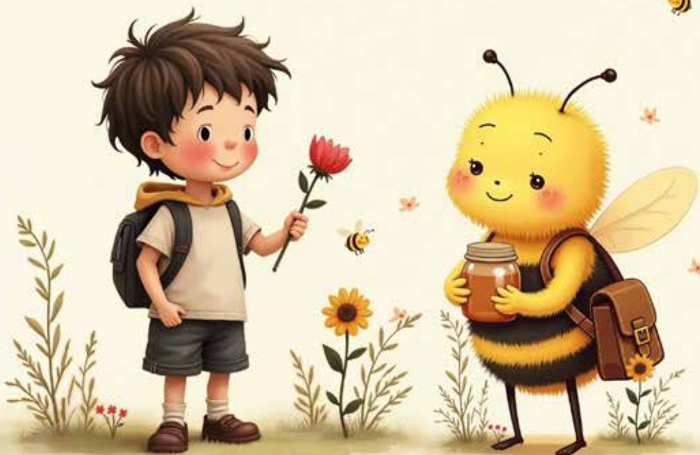
Illustrazione generata con l'utilizzo dell'intelligenza artificiale