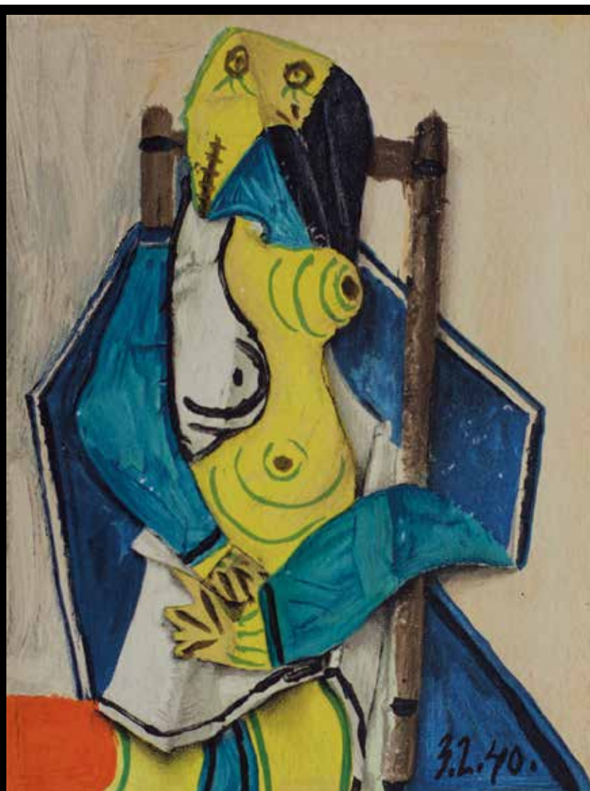
Pablo Picasso, Figure, 1957. Riproduzione litografica 32,2×43,5 cm (realizzazione dopo l'opera "Figure"; 1940) © Succession Picasso by SIAE 2025