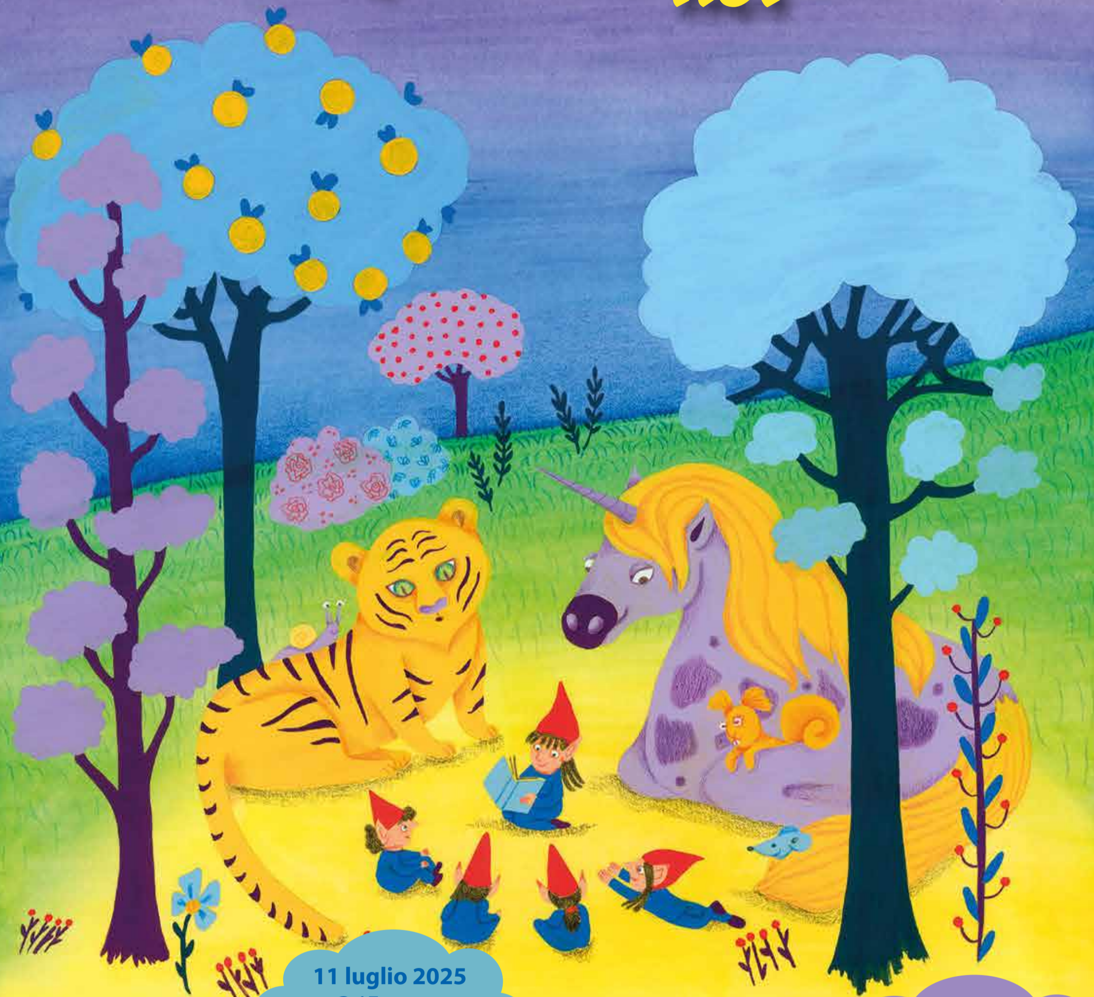
Illustrazione di Maria Padovani ©

4 luglio 2025 Parco dei Cigni I MUSICANTI DI BREMA (Susi Danesin)