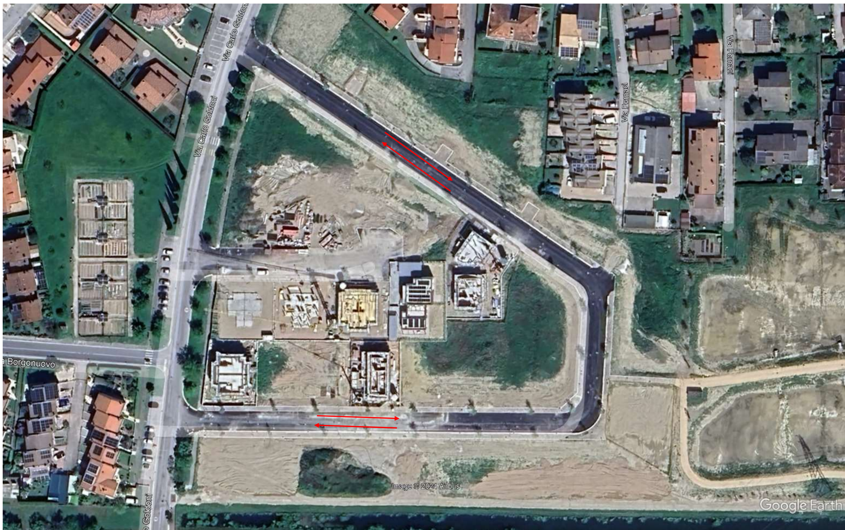
Nel momento in cui i lavori interesseranno il tratto tra il canale Fornazzi e via Fornaci si richiede la possibilità di deviare il traffico sulla via in planimetria a cui non è ancora stato assegnato un Odonimo.