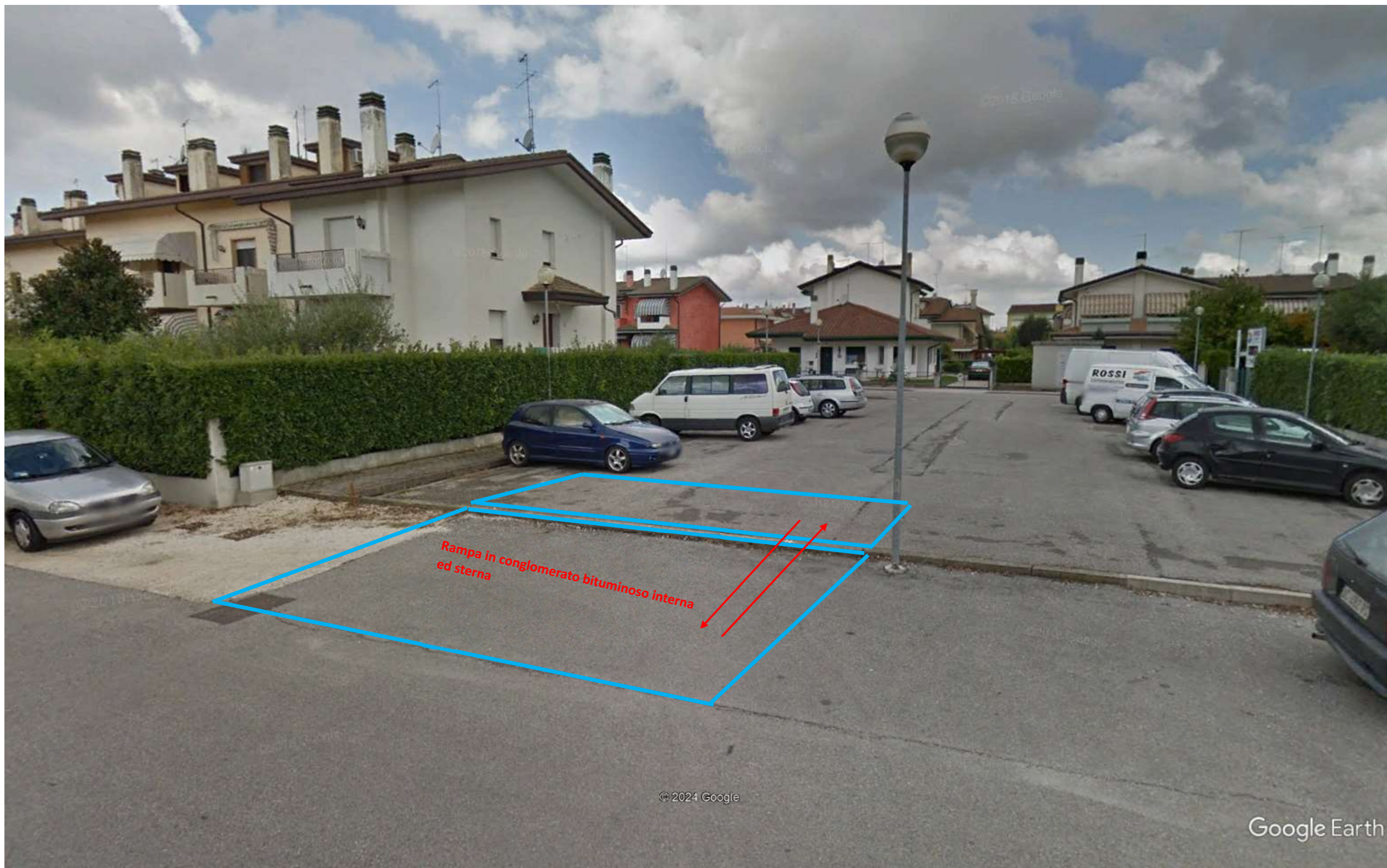
Si richiede la possibilità di creare un varco per l'accesso e l'uscita dei residenti di via Giacinto Gallina su via Fornaci