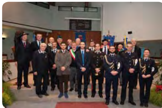
Nella foto i presidenti delle Associazioni, le Autorità civili e militari della Città durante la scorsa Festa degli Auguri del 21 dicembre 2013