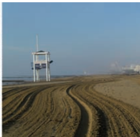
La spiaggia di Jesolo prima e dopo l'intervento di pulizia di Alisea

trando le proprie risorse su questo servizio straordinario, che ha portato la spiaggia di Jesolo, prima fra tutte quelle della Regione, nuovamente in ordine e pulita. Questa attività è stata comunque affiancata dal lavoro ordinario e costante di pulizia e monitoraggio delle strade,