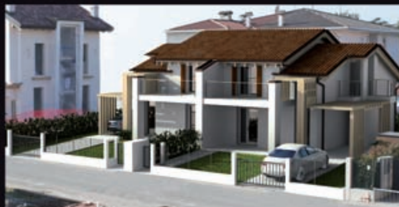
WALL TO WALL GOLD