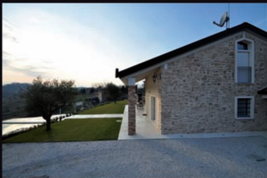
WALL TO WALL HOUSE

REALIZZIAMO EDIFICI CHIAVI IN MANO AD ALTO RISPARMIO ENERGETICO COSTRUITI CON I PRINCIPI DELLA BIOEDILIZIA E DELL'ARCHITETTURA SOSTENIBILE E SECONDO I DETTAMI DI CASA CLIMA