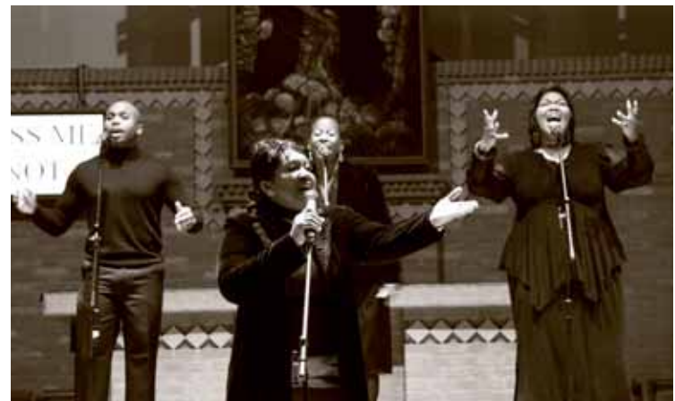
Jesolo Spirituals, immagine del concerto di piazza Milano