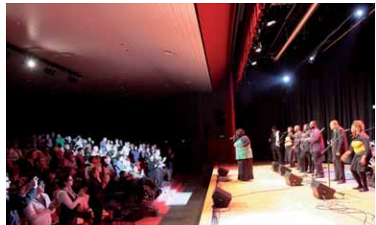
Il concerto gospel al teatro Vivaldi