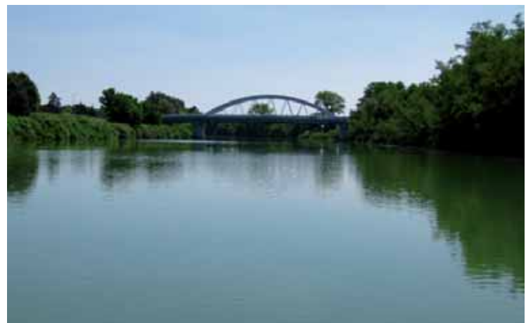
La messa in sicurezza idraulica del Piave, il più grande lavoro degli ultimi 40 anni sul nostro fiume.

Ripristino di sponda: realizzazione di mantellate in massi "a testa di cavallo" non cementati in zona Mussetta.