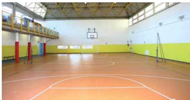
La palestra della scuola Verga, uno dei lavori realizzati nell'istituto di piazza Milano.

Inoltre, il piano ha previsto l'installazione di una nuova centrale termica con generatore a condensazione e impianto solare per l'acqua calda sanitaria per la scuola e la palestra.