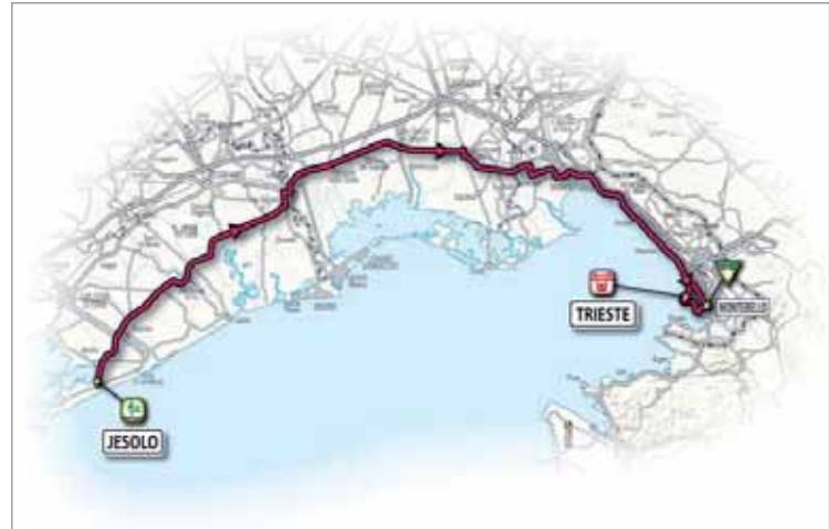
Il percorso della tappa che partirà da Jesolo il 10 maggio

diretto grazie, alle numerose presenze garantite dalla Carovana che seguirà l'evento".