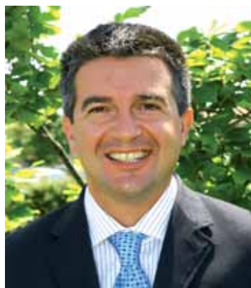
Il sindaco Francesco Calzavara

Calzavara: "Dopo aver chiuso positivamente il 2008 ci aspetta un 2009 di grandi sfide"