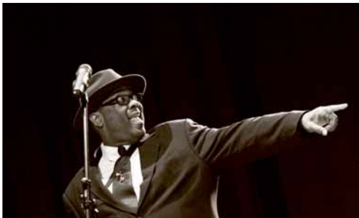
La rassegna Jesolo Spirituals ha avuto un grosso successo