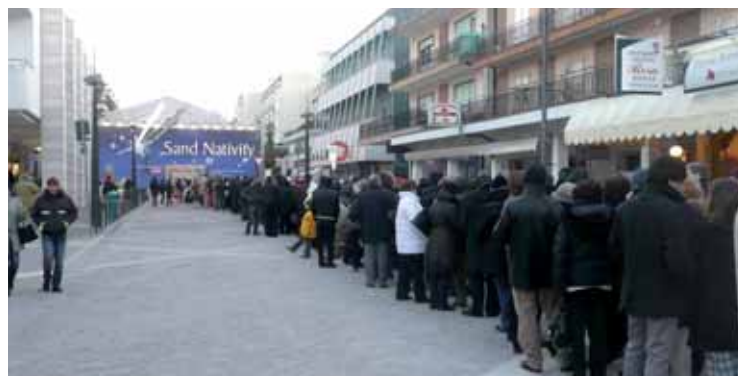
La coda in attesa di entrare a Sand Nativity

Mai come in questa edizione Sand Nativity ha avuto una tale visibilità in televisione. I servizi dedicati al presepe di sabbia, non solo sono stati molti, ma anche prestigiosi. Tutti i telegiornali nazionali – Rai e Mediaset – hanno dato notizia del presepe con servizi sul posto. Ma anche le trasmissioni di costume e attualità si sono interessate a Sand Nativity: ha cominciato Unomattina ospitando addirittura uno scultore in studio, quindi un collegamento con Supersimo di Quelli che il calcio, poi Festa italiana, la trasmissione pomeridiana di Caterina Balivo su Raiuno. Anche la stampa nazionale si è interessata all'evento: Famiglia Cristiana, per esempio, ha dedicato un bel servizio a Sand Nativity.