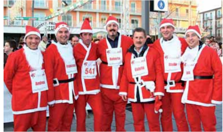
Un gruppo di partecipanti eccellenti