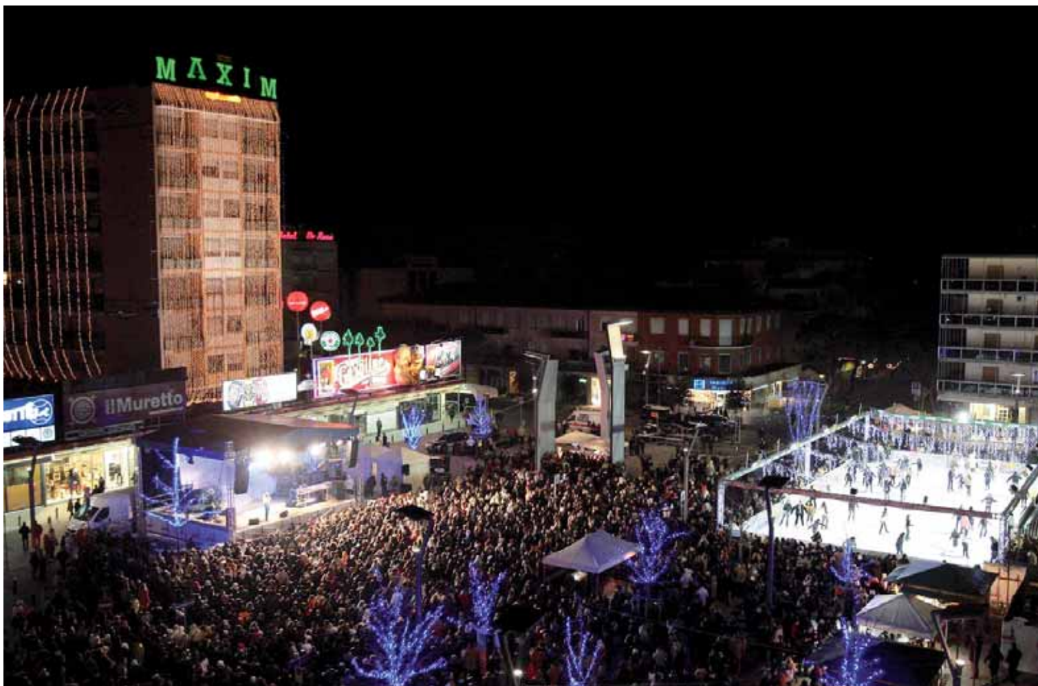
Piazza Mazzini la notte di San Silvestro