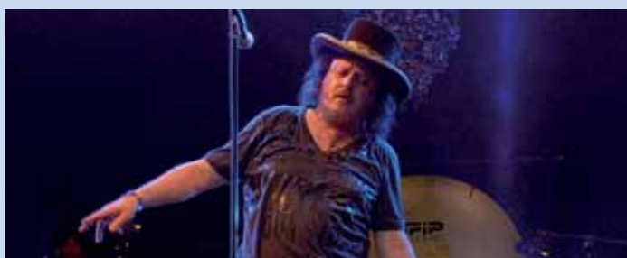
Zuccherò ha cantato sulla spiaggia del Faro lo scorso 10 agosto

Non è ancora sopito il consenso ricevuto dal ricco programma delle manifestazioni natalizie che la macchina organizzativa del Comune di Jesolo è già al lavoro per allestire quello dell'estate 2009. "La bella stagione è ancora lontana – ha detto l'assessore al turismo Alberto Carli –, ma ci stiamo già muovendo per organizzare un palinsesto di eventi che sia all'altezza della nostra località. Pur tra le difficoltà di un bilancio che deve comunque quadrare sempre e che negli ultimi anni ha subito molti tagli finanziari da parte dello stato centrale, anche per l'estate 2009 la nostra Città proporrà agli ospiti e ai residenti un programma di appuntamenti di primo livello". Gli uffici preposti stanno già prendendo i contatti con organizzatori e promoter vagliando iniziative, progetti e idee che come ogni anno terranno conto dei gusti di un pubblico molto vario. A lato presentiamo una piccola anteprima delle manifestazioni confermate per la primavera, si tratta comunque solo di una parziale anticipazione di quanto bolle in pentola a Jesolo.