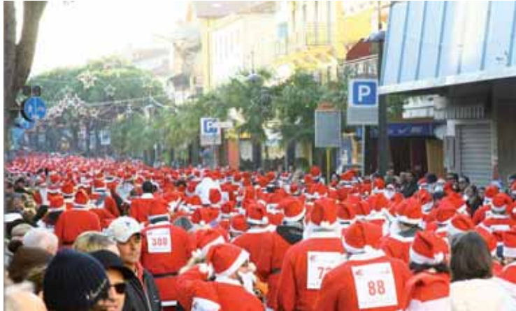
La partenza della Maratona di Babbo Natale il 21 dicembre 2008

Come è andato il Magic Winter di Jesolo? Basta guardare queste immagini e tutto diventa chiaro. C'è stato molto freddo ma questo non ha scoraggiato le migliaia di persone che hanno raggiunto la nostra Città per partecipare alle tantissime occasioni di divertimento offerte. Capodanno in piazza Mazzini? Una bella festa per le famiglie e per i ragazzi con la musica di Alexia, gli amici di radio DeeJay e una spolverata di neve proprio a mezzanotte che ha fatto da splendida cornice all'atmosfera. Sand Nativity? Code lunghissime per entrare e commenti più che positivi da parte di tutti. Ma questi sono solo due dei molti esempi che si potrebbero fare per testimoniare il successo di una grande idea: scegliere Jesolo anche a Natale.