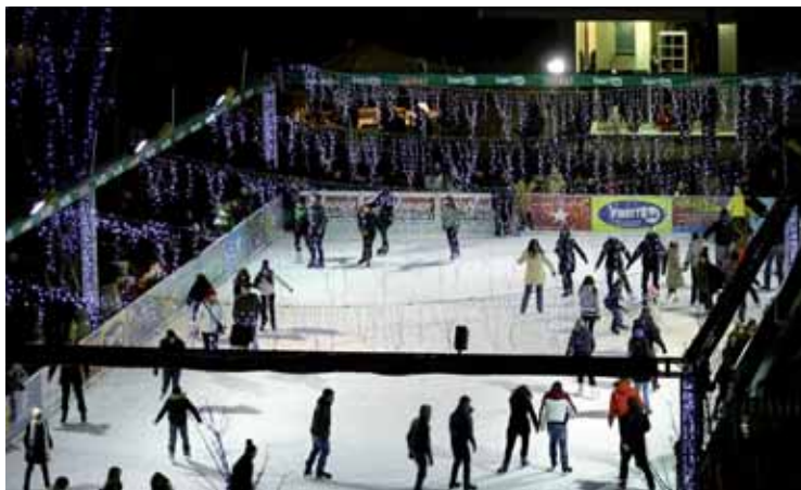
La pista di pattinaggio di piazza Mazzini