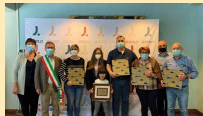
L'amministrazione comunale ha consegnato una targa alla ditta "Bonetto Grandi Impianti S.r.l." quale riconoscimento per il contributo dato alla crescita della nostra città in 58 anni di attività.