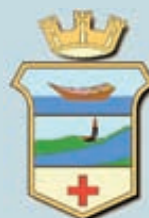
Comune di Musile di Piave

Alisea si occupa della gestione del ciclo integrato di igiene ambientale, eseguendo la raccolta e lo smaltimento dei rifiuti in un bacino di utenza di oltre 70.000 abitanti, a cui si aggiungono oltre 5 milioni di presenze turistiche all'anno nei litorali di Jesolo ed Eraclea.