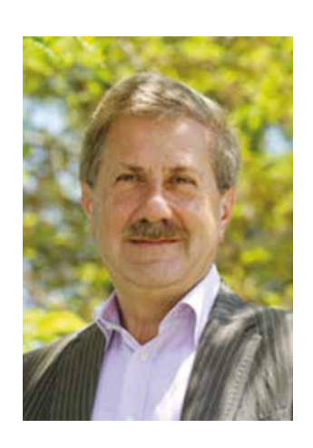
Valerio Zoggia Sindaco di Jesolo