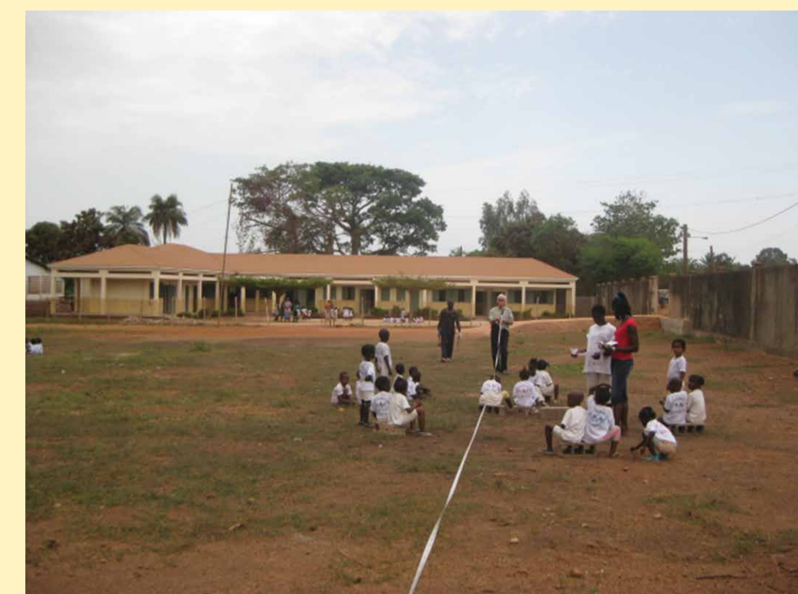
Centro polivalente "Casa Verona"

La Guinea-Bissau è uno stato dell'Africa Occidentale ed è una delle più piccole nazioni dell'Africa continentale. È il sesto paese più povero del mondo, l'88% della popolazione vive con meno di 1 dollaro al giorno e rappresenta il tipico esempio di "Emergenza Silenziosa". La qualità dell'istruzione è scarsa e poco accessibile alle bambine. La situazione politica è in costante bilico tra democrazia e dittatura, ma ci auspichiamo che con la crescita culturale, oltre che economica della popolazione, si raggiunga una situazione politica ed economica più stabile.