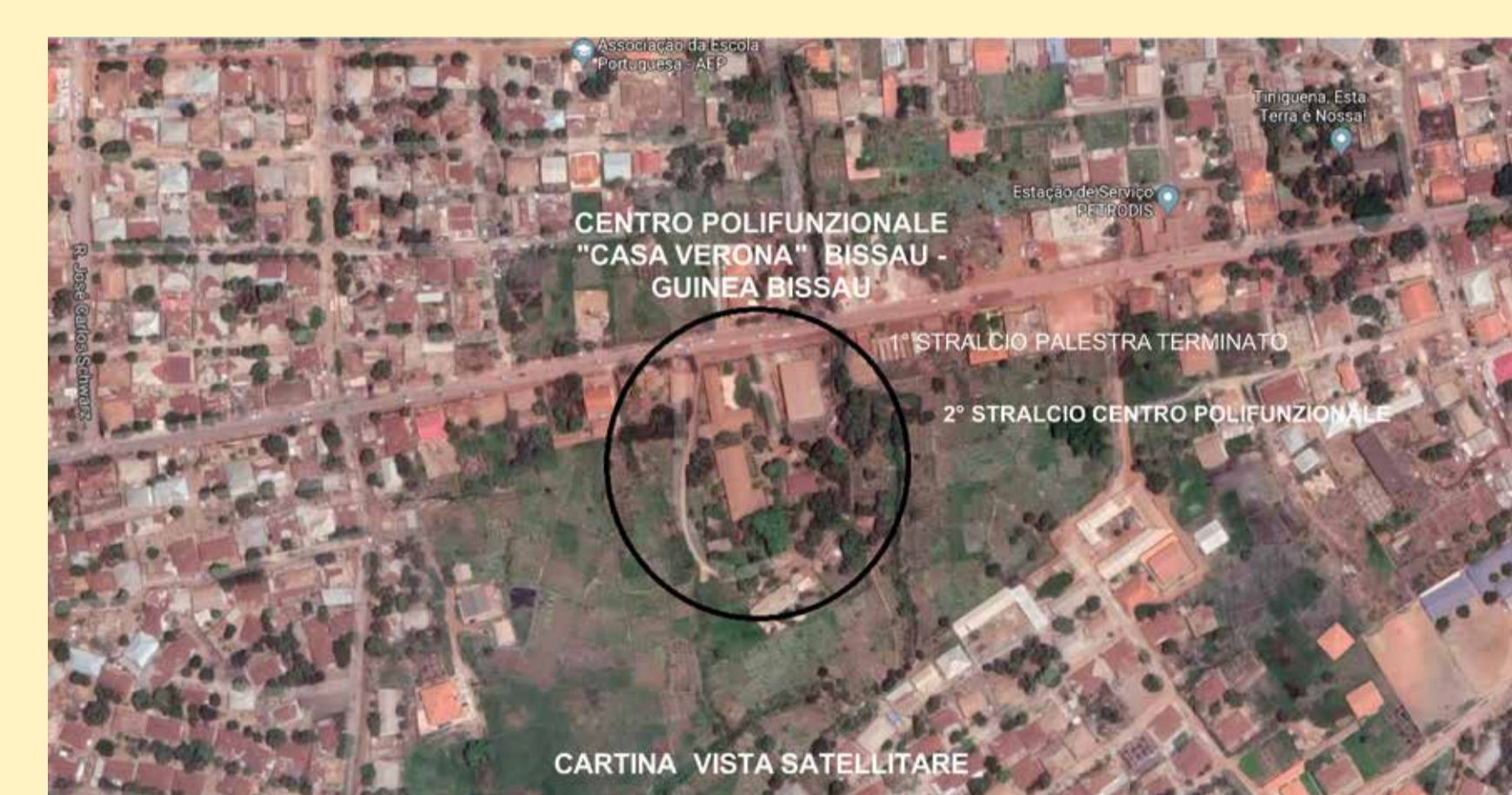
Immagine satellitare del centro

Il centro polifunzionale "Casa Verona" è costituito da una grande biblioteca, uffici e una palestra. Il complesso si sviluppa in un'area molto vasta nel centro della capitale della Guinea. In questa area trovano posto una scuola ed altri edifici adibiti a magazzino e a case di accoglienza. Lo Jesolo Sand Nativity in questi anni ha sostenuto in parte la realizzazione, sia del centro polivalente, sia della costruzione della biblioteca. Il gruppo Missionario Bedanda nel mese di novembre